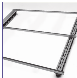
6. Schrauben Sie die Fußschiene an die Vertikalschienen.