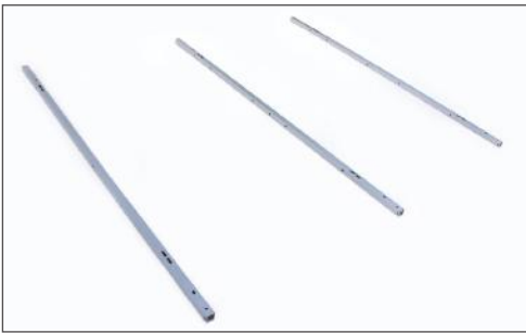
1. Legen Sie die 3 Vertikalschienen mit der geschlossene Seite nach oben wie abgebildet aus.