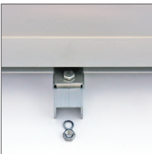
4. ...oben mit den Vertikalschienen. Verwenden sie die dafür vorgesehene Klemmen und Schrauben (6x)