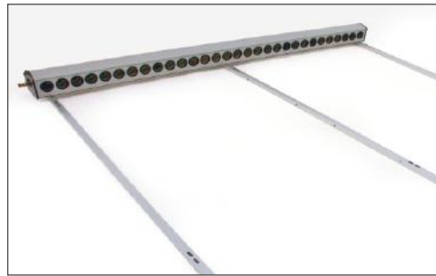
2. Positionieren Sie das Verteilergehäuse am oberen Ende