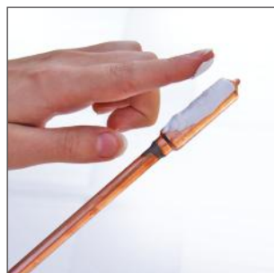
9. Verteilen Sie reichlich Kupferpaste auf den Kondensator