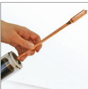
8. Ziehen Sie vorsichtig die Heatpipe am Kondensator ca.15 cm aus der Vakuumröhre.