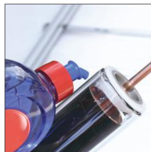
10. Geben Sie etwas Spülmittel auf die Kollektorröhre (Gleitmittel)