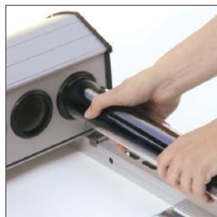
13. Schieben Sie die Röhre bis zum Anschlag in den Stützen