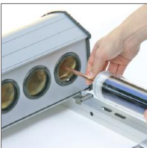
12. Führen Sie den Kondensator vorsichtig in den Rohrstützen.