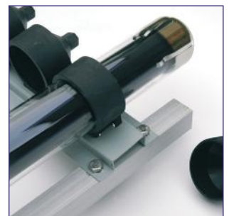
11. Stecken Sie die Vakuurröhre in den Röhrenhalter der Fußschiene.