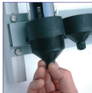
14. Nun schrauben Sie den Boden wieder in den Röhrenhalter ohne die Röhre unter Spannung zu setzen.