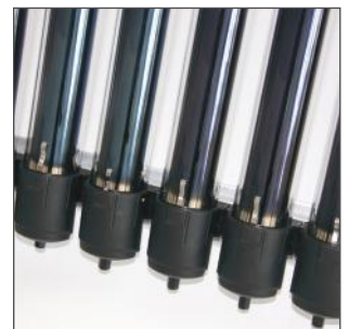
15. Verfahren Sie mit den anderen Kollektorröhren in gleicher Weise.