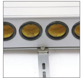
3. Verschrauben Sie die das Verteilergehäuse unten und...